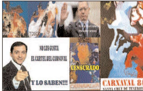
Uno de los montajes "anti-cartel del Carnaval" que circulan por las redes