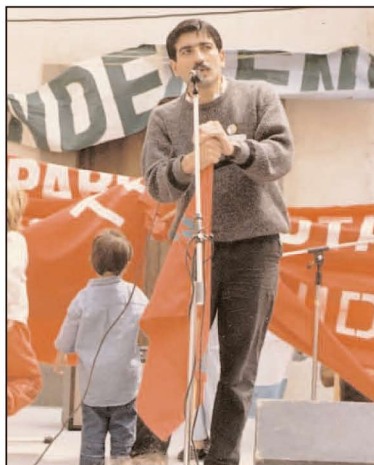
Román Rodríguez Rodríguez, cuando creía y luchaba generosamente por la unidad del nacionalismo canario.