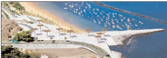
Proyecto de impresionante plaza de Perrault sin el "mamotreto"... porque "desaparecería" quedando debajo