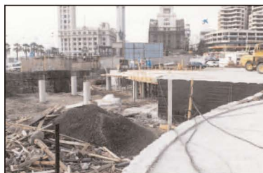
Curiosos muros negros "invisibles" en la Plaza de España